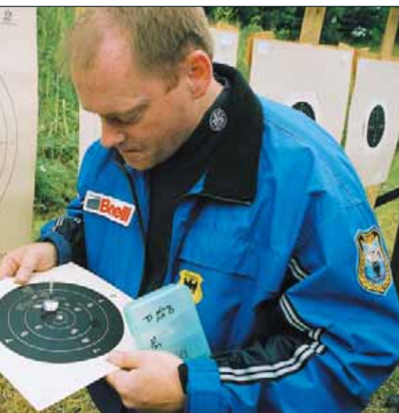
Tolkning på Örebropricken: Tia eller nia?