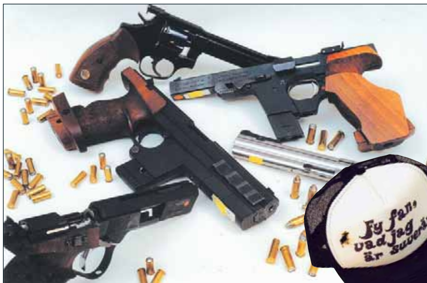
Mera B-skytte! Säger Örebroarna och sticker ut hakan med utmaningen; VÄST ÄR BÄST! Om ingen klår dem lär väl deras kepsar se ut som den till höger nästa säsong...